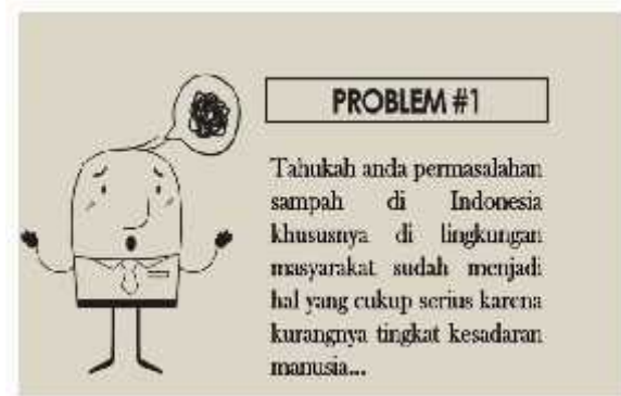
Gambar 4. Menampilkan Halaman Animasi dan Tulisan