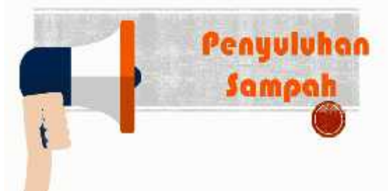
Gambar 3. Menampilkan Halaman Cover