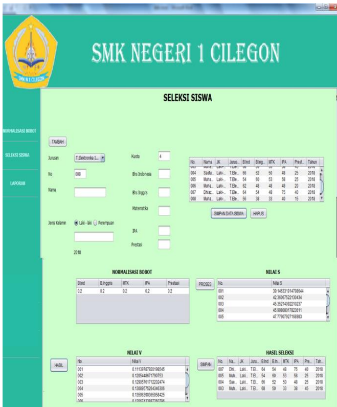
Gambar 2. Screen shot program