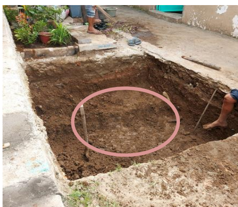
Gambar 6. Penggalian pembuatan rain water harvesting

Eksekusi terkait pembuatan rainwater harvesting dilakukan setelah perhitungan biaya survey bahan material. Langkah pertama adalah melakukan penggalian lubang utama penampung air pada sumur resapan (Gambar 6). Penggalian dilakukan oleh dua orang dengan menggunakan alat manual sehingga bisa selesai dalam waktu 1 pekan.