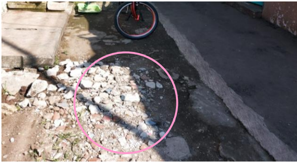
Gambar 3. Survey lokasi pengabdian

water harvesting di daerah Kelurahan Beji (Gambar 4).