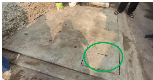
Gambar 8. Sumur resapan