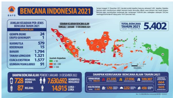
Gambar 1. Infografis Bencana di Indonesia Tahun 2021 (Badan Nasional Penanggulangan Bencana, 2021)

disebabkan oleh faktor iklim atau juga karena penebangan hutan secara liar yang membuat tanah di sekitar suatu daerah tidak dapat menyerap air dengan baik (Verianty, 2022).