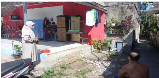
Gambar 4. Koordinasi dengan Ketua LPM Kelurahan Beji, Kota Depok

Tahap pelaksanaan dilakukan di lokasi pengabdian apabila perizinan telah diperoleh. Kegiatan dimulai dengan melakukan pembuatan gambar DED ( Detailed Engineering Design ) secara 3 dimensi menggunakan software Google SketchUp . Kegiatan dilanjutkan perhitungan biaya dan survei bahan material yang sesuai dengan anggaran dan spesifikasi desain. Kegiatan dilanjutkan dengan melakukan pembuatan rain water harvesting sampai dengan dapat difungsikan sesuai dengan rancangan/desain.