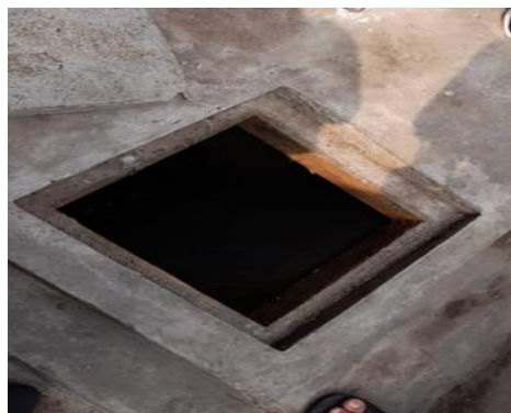
Gambar 7. Lubang resapan

Rain water harvesting yang dihasilkan memiliki serapan 2 kali lebih cepat dibandingkan sebelumnya. Bisa diilustrasikan di lokasi pengabdian air hujan biasanya akan surut dalam waktu setengah jam. Dengan adanya sumur resapan ini, air hujan yang datang bisa surut dalam waktu 10-15 menit untuk luas area lapangan kiranya 80 m 2 .