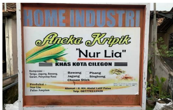
Gambar 1. UMKM "Nur Lia"

Kapasitas produksi kripik pisang UMKM "Nur Lia", Desa palas, masih rendah dan kualitasnya masih beragam. UMKM memiliki tiga karyawan dengan peralatan yang digunakan masih manual. Produksi yang masih rendah disebabkan peralatan yang dipergunakan masih sederhana (manual) membuat ukuran kripik pisang menjadi beragam (Gambar 2). Permasalahan yang sangat dirasakan oleh pemilik adalah kripik pisang yang diproduksi terlalu menghabiskan waktu yang cukup lama. Untuk 50 kg buah pisang mulai pengupasan dan pengirisan memerlukan waktu 60-75 menit. Selain itu hasil ukuran kripik yang masih beragam dan hampir 30%, kripik yang dihasilkan berukuran kecil dan tidak seragam. Penggunaan alat pengiris yang masih manual juga berbahaya bagi pekerja karena rawan terkena kemungkinan tangan ikut tersayat.