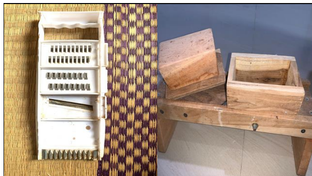
Gambar 2. Alat pengiris kripik

Kapasitas produksi kripik pisang UMKM "Nur Lia", Desa palas, masih rendah dan kualitasnya masih beragam. UMKM memiliki tiga karyawan dengan peralatan yang digunakan masih manual. Produksi yang masih rendah disebabkan peralatan yang dipergunakan masih sederhana (manual) membuat ukuran kripik pisang menjadi beragam (Gambar 2). Permasalahan yang sangat dirasakan oleh pemilik adalah kripik pisang yang diproduksi terlalu menghabiskan waktu yang cukup lama. Untuk 50 kg buah pisang mulai pengupasan dan pengirisan memerlukan waktu 60-75 menit. Selain itu hasil ukuran kripik yang masih beragam dan hampir 30%, kripik yang dihasilkan berukuran kecil dan tidak seragam. Penggunaan alat pengiris yang masih manual juga berbahaya bagi pekerja karena rawan terkena kemungkinan tangan ikut tersayat.