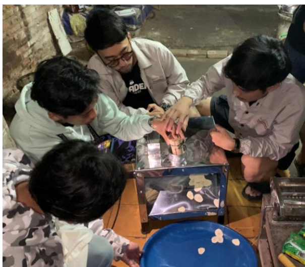
Gambar 4. Uji coba alat

Tahap selanjutnya adalah uji coba alat pengiris pisang yang telah dibuat ( Gambar 4 ). Uji coba ini bertujuan untuk mengetahui kinerja alat dengan menggunakan pisang kepok. Kinerja yang diuji adalah tingkat produktivitas, keseragaman dan tebal irisan yang dihasilkan. Uji coba juga bertujuan untuk mengevaluasi kinerja peralatan sebelum dilakukan serah terima kepada UMKM "Nur Lia"