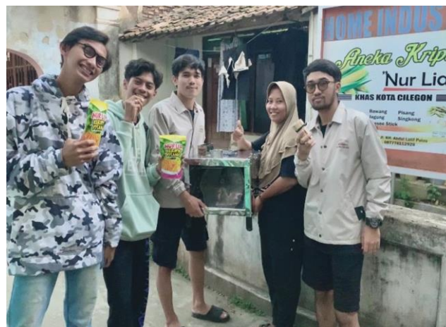
Gambar 5. Serah terima alat

pengirisan 3-5 kali dibandingkan menggunakan alat pengiris yang selama ini digunakan. Hal ini sejalan dengan hasil yang dilakukan Pamungkas et al. (2021), dimana penggunaan alat bantu mampu meningkatkan 3 kali produktivitas produksi keripik pisang. Peningkatan produktivitas akan berdampak baik bagi UMKM "Nur Lia" untuk meningkatkan kapasitas produksi atau perluasan pasar. Perancangan alat ini belum memperhatikan diameter pulley yang mempunyai pengaruh terhadap kecepatan dan kapasitas irisan (Ardiansyah & Suartiyanti, 2022).