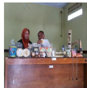
Gambar 5. Serah terima produk kkm

Pada penarikan KKM ini dipamerkan produk – produk hasil dari desa Sukamaju Kecamatan Cikeusal dan produk KKM lainnya dari desa-desa yang terletak di Kecamatan Cikeusal. Kegiatan ditutup dengan acara silaturahmi dan makan bersama warga desa.