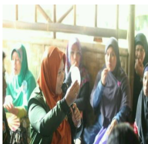
Gambar 2. Pelatihan pembuatan sabun Milan dari Minyak Jelantah

Pada sosialisasi program kami berharap para ibu rumah tangga yang hadir dapat mempraktekkan hasil pelatihan ini. Peserta juga menanggapi kegiatan ini secara positif dan antusias.