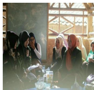
Gambar 4. Pelatihan pembuatan Krupuk tahu dari ampas tahu (LimbahTahu)