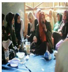
Gambar 3. Pelatihan pembuatan sabun Milan dari Minyak Jelantah