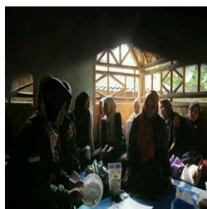
Gambar 5. Pelatihan pembuatan Krupuk tahu dari ampas tahu (LimbahTahu)