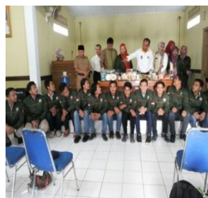
Gambar 5. Serah terima produk kkm

Setelah diadakan sosialisasi dan pelatihan pembuatan sabun Milan yang terbuat dari minyak jelantah serta kerupuk tahu yang terbuat dari ampas tahu, produk-produk yang dihasilkan diserahkan pada Kecamatan Cikeusal dalam acara penarikan KKM Unsera pada tanggal 28 Agustus 2017 di Kecamatan Cikeusal yang dihadiri oleh Camat Cikeusal, para Kepala Desa se- Kecamatan Cikeusal, para Dosen Pembimbing Lapangan, dan perwakilan mahasiswa KKM unsera di Kecamatan Cikeusal.