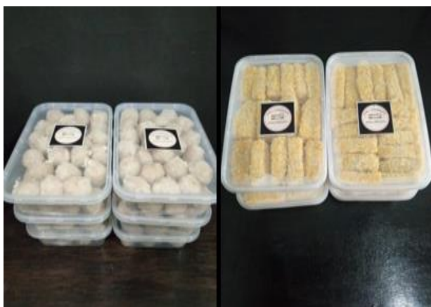
Gambar 4. Bakso dan nugget azka frozen

Frozen food adalah jenis makanan yang diawetkan dengan teknik pembekuan dengan temperatur berkisar -18 derajat celcius atau lebih rendah. Tujuan pembekuan adalah membuat makanan menjadi lebih tahan lama (Materi Pertanian, 2018). Makanan jenis ini sudah banyak ditemukan di wilayah Kecamatan Cileungsi.