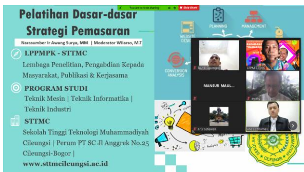
Gambar 2. Foto tangkap layar kegiatan PkM

Kegiatan dengan tema "Pelatihan Dasar-dasar Strategi Pemasaran" ini telah terselenggara dengan lancar tepatnya Rabu 14 Juli 2021. Acara berlangsung dari pukul 08.30 sampai 11.30 WIB. Kegiatan ini diikuti secara daring oleh 15 pelaku UMKM dengan berbagai jenis produk. Lebih dari setengah peserta, yaitu 8 orang adalah pelaku usaha kuliner. Sehubungan dengan pandemi dan diberlakukannya kebijakan PPKM (Pembatasan Pembatasan Kegiatan Masyarakat) darurat maka kegiatan pelatihan dilaksanakan secara daring dengan media zoom meeting (Gambar 2).