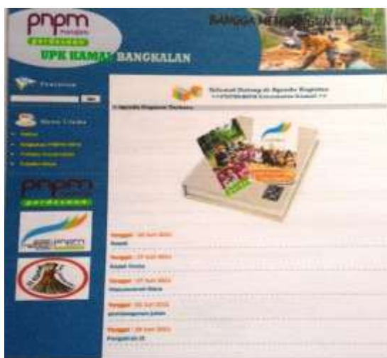
Gambar 11. Halaman beranda pengunjung

Hak akses yang dimiliki oleh seorang pengunjung berbeda dengan hak akses seorang administrator, yang mana seorang pengunjung hanya memiliki hak akses untuk melihat saja. Pengunjung tidak dapat menambah, merubah atau bahkan menghapus data dari sistem. Tampilan dari menu pengunjung ini, ditunjukkan oleh Gambar 11.