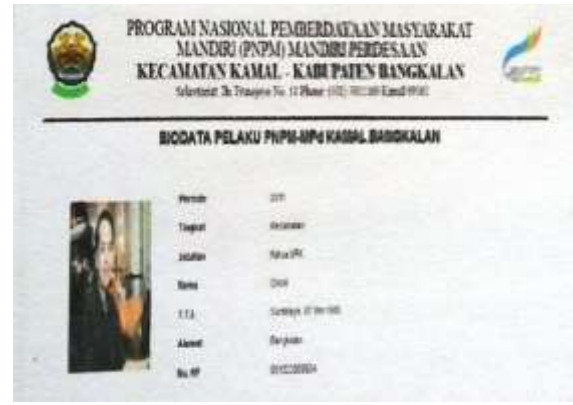
Gambar 8. Laporan pelaku PNPMM secara individu