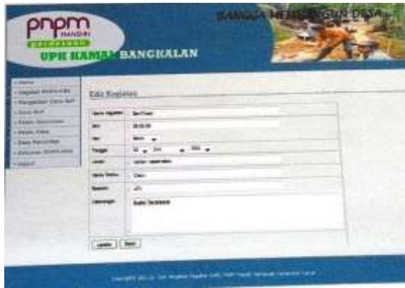
Gambar 5. Halaman edit kegiatan