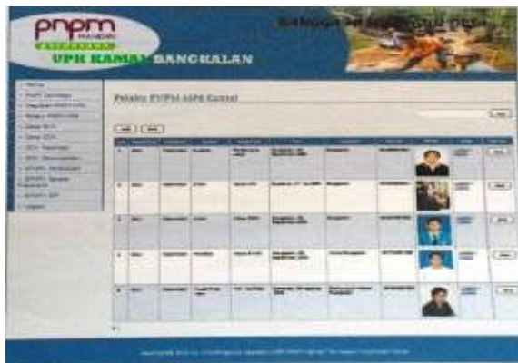
Gambar 6. Halaman pelaku PNPMM