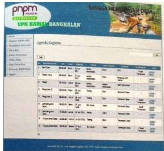
Gambar 3. Halaman kegiatan PNPM

Selain halaman beranda, seorang admin dapat menginformasikan seluruh kegiatan PNPM Mandiri perdesaan kecamatan Kamal yang ditunjukkan oleh gambar 3. Fitur pada halaman tersebut antara lain, nama kegiatan, jam, hari, tanggal, lokasi, pelaku serta sarasannya.