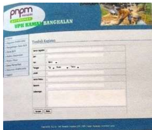
Gambar 4. Halaman tambah kegiatan

Pada halaman ini, seorang admin dapat menambah, memperbaiki maupun menghapus field kegiatan sesuai dengan jadwal dan ketentuan PNPM MP kecamatan Kamal. Sehingga sistem informasi ini dapat bermanfaat karena sistemnya otomatis dengan menambah data dan memperbaiki ataupun menghapus kesalahan. Untuk tampilan menu tambah atau add ditunjukkan oleh Gambar 4. Sedangkan menu untuk memperbaiki atau update ditunjukkan oleh Gambar 5. Setelah halaman beranda, seorang admin juga memiliki hak akses untuk menambah, memperbaiki maupun menghapus data pelaku PNPM MP kecamatan Kamal. Begitu pula dengan tabel lainnya. Tampilan halaman ditunjukkan oleh Gambar 6.