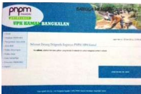
Gambar 2. Halaman beranda administrator

Admin memiliki beberapa akses yang berbeda dengan pengguna biasa. Jika seorang admin ingin menggunakan hak akses tersebut maka harus melakukan login terlebih dahulu. Setelah itu masuk ke halaman beranda. Kemudian Yang ditunjukkan pada Gambar 2.