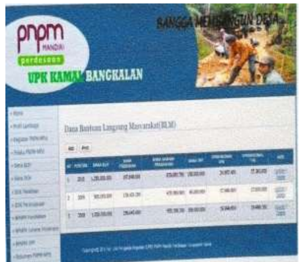
Gambar 9. Halaman Dana BLM

Pada Gambar 7 dan 8 menampilkan laporan yang siap cetak tentang data para pelaku PNPMM. Baik itu data perorang maupun data semua pelaku PNPMM Mandiri kecamatan Kamal.