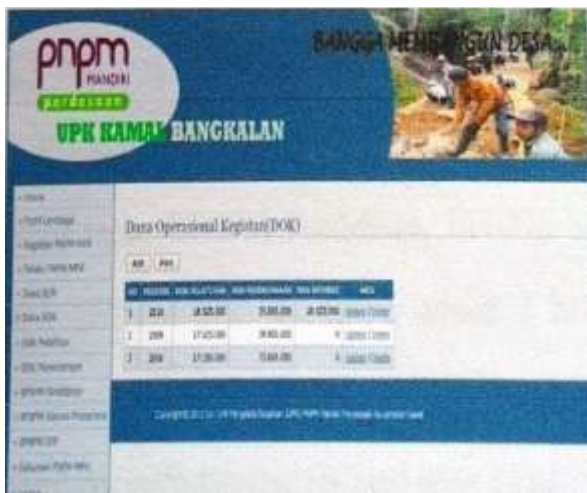
Gambar 10. Halaman DOK