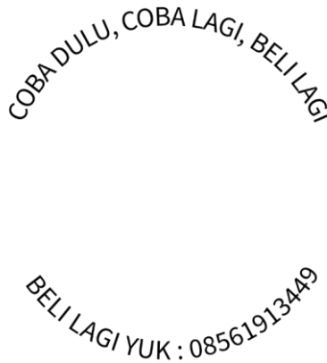
Gambar 3 Caption logo

Bentuk lingkaran dipilih karena lingkaran tidak memiliki sudut, yang artinya dengan harapan bahwa usaha ini akan berdiri selamanya.