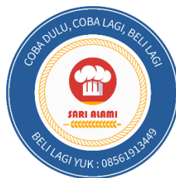
Gambar 1 Logo

Sebuah logo akan mewakili citra dari sebuah perusahaan dan menjadi identitas bagi pemiliknya. Dari kondisi pasar yang memiliki banyak kompetitor, logo bisa menjadi cara untuk membedakan diri dengan kompetitor. Dengan ini jelas bahwa logo berfungsi sebagai identifikator sebuah produk oleh konsumen, sehingga konsumen akan mengenali barang yang ia konsumsi secara sadar mengenali siapa pembuatnya. Dengan logo juga dapat memberikan citra yang positif pada perusahaan karena telah menunjukkan kepercayaan diri usaha pada konsumen dan kompetitor. Terlihat lebih baik daripada sebelumnya yang tidak memiliki logo sama sekali, pembuatan desain logo ini pula tetap berprinsip pada kesederhanaan supaya dapat dipahami dan dimengerti. Serta tidak lupa pula masing masing logo harus memiliki kaitan satu sama lain sehingga tiap bagiannya tidak terpisahkan.