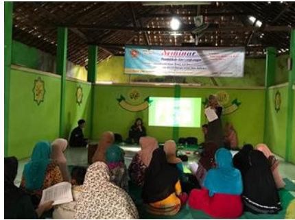
Gambar 3.1. Pelaksanaan seminar Pendidikan Sosialisasi Kejar Paket A, B dan C