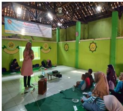
Gambar 3.3. Pemateri dalam Seminar