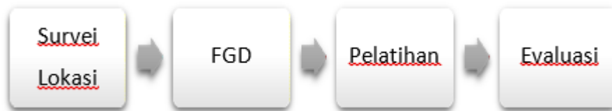
Gambaran IPTEK dalam pengabdian masyarakat yang akan di transfer kepada Mitra

Metode pelaksanaan dalam pelatihan ini diawali dari pemetaan persoalan mitra dan profil dari peserta pelatihan dengan forum Focus Group Discussion (FGD), kemudian diturunkan ke dalam materi pelatihan perencanaan bisnis dengan metode yang lebih praktikal dan sederhana. Materi pelatihan meliputi analisis SWOT ( Strength, Weakness, Opportunity and Threat ), sharing persoalan antar peserta, pelayanan internal dan eksternal (service, komunikasi bisnis) Setelah pelatihan, akan dilakukan pendampingan dalam jangka waktu yang ditentukan kemudian bersama KSP Credit Union Madani selaku mitra. Penutup dari kegiatan pengabdian masyarakat ini adalah monitoring evaluasi eksternal bersama peserta dan internal bersama anggota tim, pengurus fakultas, dan LPPM UBD.