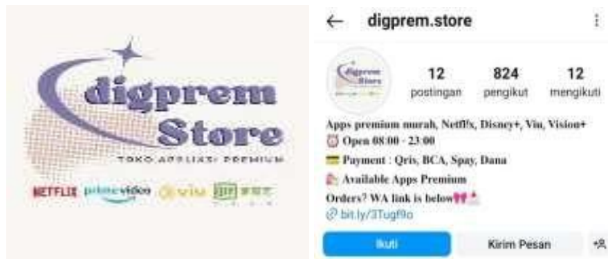
Gambar 1 Logo dan akun instagramonline shop @digprem.store