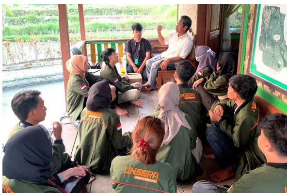
Gambar 2. Survey Tentang Lingkungan Desa Dan Faktor Putus Sekolah

dalam undang-undang Dasar pasal 31 ayat (3) tahun 1945, tentang akomodasi hak pendidikan yang layak dari pemerintah bagi warga negara dan wajib mengikuti pendidikan dasar. Oleh karena itu pada usia dini wajib diberikan pendidikan, bimbingan dan pengalaman yang positif, sebab kesannya akan disimpan di otaknya sampai hari tuanya. Usia dini merupakan fase penting dalam pertumbuhan anak. Proses pembentukan identitas dan karakter dimulai sejak usia dini. Untuk itu nilai-nilai kesetaraan yang tidak menganggap diri dan kelompok sendiri sebagai superior atas yang lain sangat penting ditanamkan kepada anak sedini mungkin. Namun, tidak dapat dipungkiri tinta hitam diatas kertas kadang belum cukup menjadi pengikat atas dasar kewajiban pemerintah yang seharusnya terlaksana.