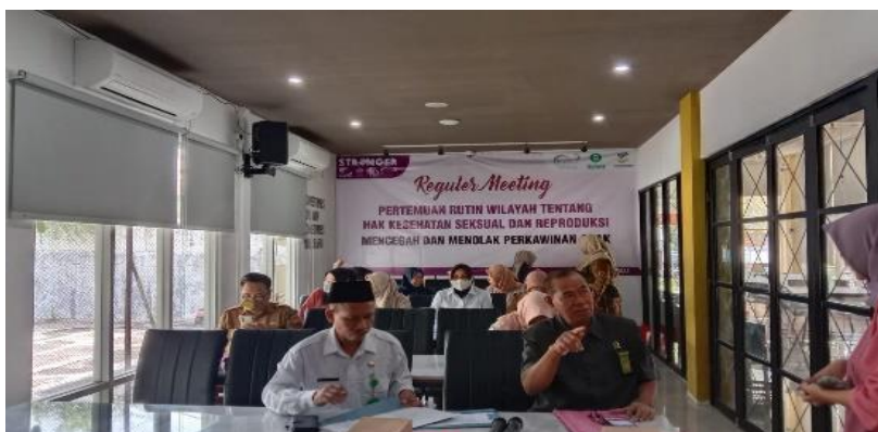
Gambar 1. Pelaksanaan Pertemuan Rutin

Peneliti mencantumkan gambar dibawah ini sebagai data pendukung dari adanya dialog tatap muka yang dilakukan.