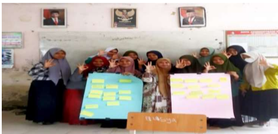
Gambar 1. Kelompok PIKR Tunas Bangsa Desa Lawa Batu

Maka, kehadiran PIKR sangat membantu anak mempunyai tempat berlindung apabila lingkungan keluarga bukan lagi menjadi tempat yang aman. Tidak hanya itu, GenRe juga turut andil dalam membantu kader PIKR secara immaterial karena kedua organisasi ini sama-sama bertugas sebagai konselor yang memeberi layanan konseling. kelompok ini juga dibina sesuai dengan modul dan kurikulum pembelajaran yang telah disusun oleh BKKBN. PKB kecamatan akan terus memantau berapa target yang telah disusun yang mampu diwujudkan pada desa-desa yang terpilih serta memantau kinerja aktif dari kelompok PIK R itu sendiri. PKB dan PLKB saling berkoordinasi dalam memegang peran sebagai konselor dan fasilitator.