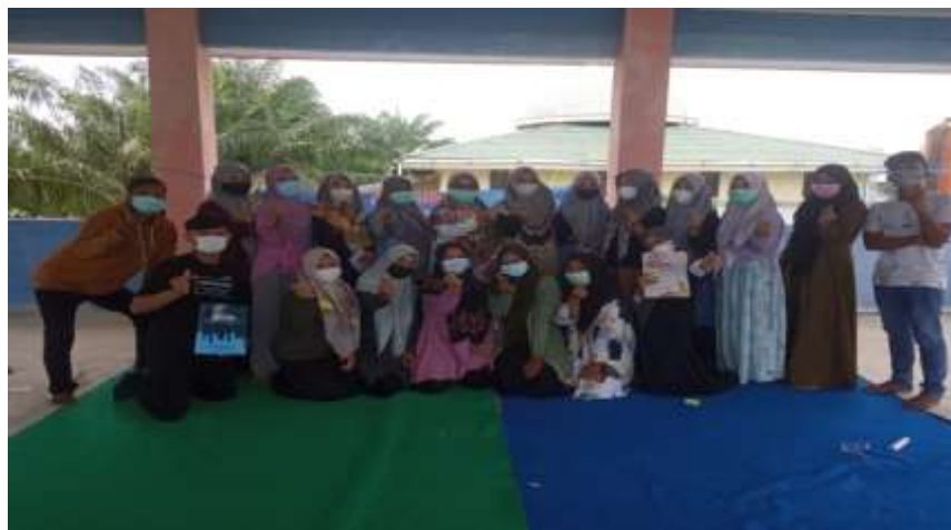
Gambar 2. GenRe Kabupaten Nagan Raya

Melalui forum ini, pemerintah merasa terbantu karena anak sendiri lah yang menjadi actor terdepan sebagai agen pelopor dan pelapor dalam membantu generasi muda yang berencana lebih baik dalam mempersiapkan diri untuk masa depan yang serba terencana. Genre merangkul anak-anak ataupun remaja dengan sukarela secara tegas berani menolak jika dipaksa menikah di usia dini, dan berani tegas menuntut hak berpendidikan dalam hidupnya. Sesama remaja, mereka menyebarkan informasi bahaya pernikahan dini yang dapat berefek pada kesehatan mental apalagi menikah dalam keadaan yang tidak siap karena usia yang muda dan masih belum merencanakan kehidupan di dalam rumah tangga. Demi menyuarakan makna kesehatan reproduksi, OPD KB selaku Pembina memberi penyuluhan bahwa pernikahan yang dilakukan di usia belia dan kemudian sang ibu hamil, hal itu akan membuat potensi bayi yang dilahirkan menjadi stunting serta berpotensi menjadi keluarga yang mengalami kesenjangan social dan ekonomi. Selain itu moral-moral pergaulan bagi remaja juga begitu ditekankan apalagi banyak di kalangan mereka yang berpacaran.