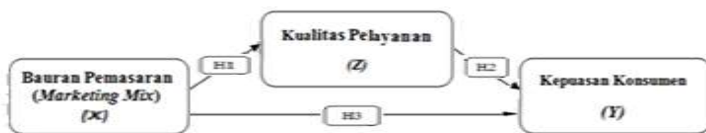
Gambar Konstelasi Penelitian

Keterangan :X adalah Bauran Pemasaran ( Marketing Mix ), Y adalah Kepuasan Konsumen Perum Metro Cilegon, Z adalah Kualitas Pelayanan Perum Metro Cilegon.