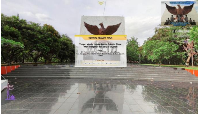
Gambar 4.2 Tampilan Awal Aplikasi

Tampilan awal website adalah tampilan yang paling pertama kali muncul ketika user mengakses halaman aplikasi virtual tour untuk tempat wisata Lubang Buaya. Tampilan ini berisikan pop up yang terdapat tulisan judul aplikasi, pesan, alamat. Kemudian terdapat tampilan menu disebelah kanan atas 7 pahlawan revolusi, scene , about developer , play/pause music . Dibagian kiri bawah terdapat tampilan untuk show/hide navigation