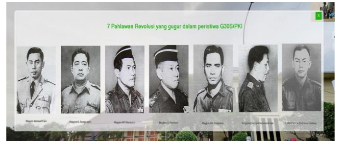
Gambar 4.4 Tampilan Fitur 7 Pahlawan Revolusi

Tombol 7 pahlawan revolusi adalah tombol yang berfungsi untuk memberikan informasi kepada user tentang 7 pahlawan revolusi, dimana ketika user klik foto pahlawan akan muncul pop up histori pahlawan tersebut.