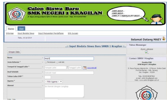
Gambar 1. Formulir Input Biodata

Sistem dibuat dengan menggunakan php hypertext procesor, berikut Forminputnya: