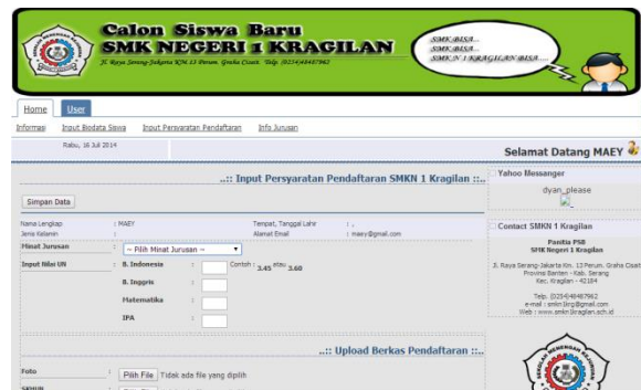
Gambar 2. Formulir Input Persyaratan dan Nilai UN