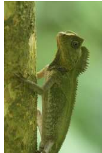
Gambar 5. Reptil

Warna tubuh mereka dapat bervariasi antara cokelat tua, hijau, hingga warna kekuningan, dengan pola-pola yang khas yang membantu mereka menyamar di antara lingkungan hutan yang lebat. Bunglon ini juga memiliki kulit yang kasar dengan tonjolan dan alur-alur yang khas di sepanjang tubuh mereka.