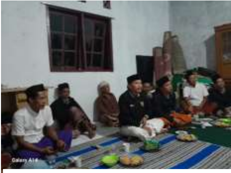
Gambar 2. Rembuk dengan Kelompok Tani Desa Cisitu

Kegiatan penanaman pada program “Restorasi Keanekaragaman Hayati Flora dan Fauna”, dalam rangka pembangunan taman KEHATI di Desa Cisitu Kecamatan Ciomas Kabupaten Serang, dibagi menjadi 2 (dua) kegiatan, yaitu kegiatan penanaman dengan tujuan pengkayaan dan pembangunan taman bunga seluas 250 meter persegi. Jenis bibit yang ditanam didasarkan pada rekomendasi Tenaga Ahli Kehati, sedangkan lokasi penanaman didasarkan pada rencana tapak ( site plan ) yang didesain oleh Tenaga Ahli Lanskap, sedangkan untuk sosialisasi dan komunikasi dengan kelompok tani KTH Harapan Jaya dilakukan oleh Tim Pengabdian dari Prodi Komunikasi Universitas Sultan Ageng Tirtayasa.