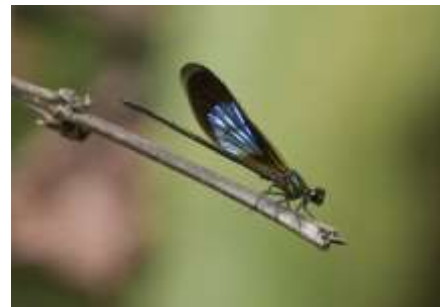
Gambar 6. Capung

Temuan menarik untuk serangga adalah adanya Capung jarum, atau disebut juga sebagai capung kayu, adalah jenis capung yang sering ditemukan di sekitar air, terutama di habitat-habitat seperti rawa, danau, sungai, atau kolam. Meskipun mereka biasanya ditemukan di sekitar air, capung jarum tidak hidup dalam air seperti larva capung lainnya, tetap menghabiskan sebagian besar waktu mereka di habitat di sekitar air tersebut. Berikut adalah beberapa peranan capung jarum terhadap air: