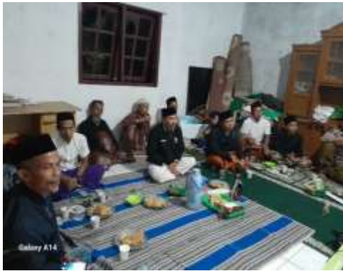
Gambar 3. FGD Dengan Kelompok Tani Desa Cisitu

Taman Kehati Desa Cisitu - Ciomas, Serang Banten, memiliki habitat fauna yang beragam serta ekosistem lingkungan seimbang bagi berbagai jenis burung. Keanekaragaman yang tinggi, pemerataan yang baik, serta dominasi rendah merupakan indikasi kondisi ekologis yang sehat dan berkelanjutan bagi komunitas burung di wilayah tersebut. Jenis burung yang ada di wilayah tersebut terbagi