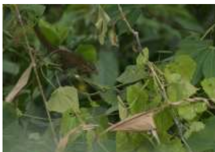
Gambar 4. Tupai

Untuk mamalia yang ditemukan adalah jenis tupai kekes ( Tupaia javanica ). Tupai kekes adalah mamalia kecil berukuran sekitar 15 cm dengan ekor sepanjang 18 cm. Tubuhnya berwarna kuning coklat abu-abu dengan bintik-bintik hitam dan bagian perut berwarna kekuningan.