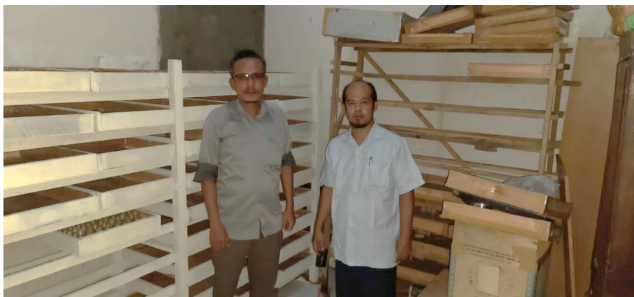
Gambar 5. Tim Pengabdian dan Tim Pendamping LPPM UNIMED

Setelah semua Kegiatan yang direncanakan pada mitra selesai dilakukan, Tim Pengabdian melaksanakan tahapan akhir dari Kegiatan Pengabdian yaitu evaluasi kegiatan (Gambar 5) yang dilakukan pada kelompok peternak ulat jerman dengan mengobservasi dan bertanya secara langsung kondisi usaha mitra setelah adanya pemberian tambahan kandang pembesaran ulat jerman (rak dan kotak) dan kegiatan pelatihan yang dilaksanakan.