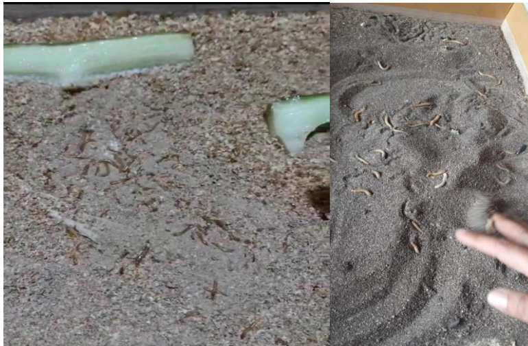
Gambar 4. Ulat Jerman yang masih kecil

Selanjutnya kumbang dewasa dipindahkan ke kandang kedua. Ini dilakukan agar kumbang dewasa tidak memakan telur dan larva yang sedang tumbuh. Larva yang baru menetas dibiarkan hidup di kandang pertama. Setelah itu larva diberikan potongan buah dan sayur hingga ia siap untuk dibiakkan atau dijadikan pakan peliharaan. Larva (Gambar 4) membutuhkan waktu beberapa minggu atau bulan untuk tumbuh dewasa