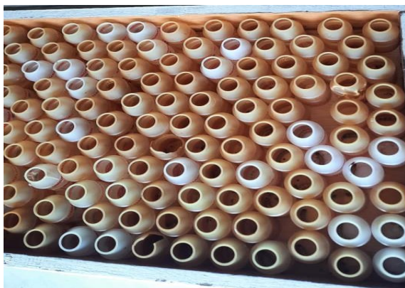
Gambar 2. Wadah Proses Pembuatan Indukan

Untuk membiakkan ulat jerman menjadi kumbang dilakukan dengan cara antara lain : 1) memilih 50-100 ekor ulat jerman. 2) Ulat-ulat tersebut masing-masing ditempatkan pada kotak bersekat atau berupa wadah plastic bekas botol minuman seperti yakult (Gambar 2) dan sejenisnya. Penempatan ini bertujuan mengkondisikan tempat menjadi gelap untuk membantu ulat menjadi kepompong. 3) Menyediakan sedikit substrat di setiap wadah ulat jerman sebagai alas dan sumber nutrisi larva ulat jerman. 4) Menempatkan wadah di tempat hangat (dengan suhu sekitar 27 o ) dan gelap selama 10 hari. 5) Mengecek larva untuk melihat apakah sudah berubah menjadi kepompong selama 7 hingga 10 hari. 6) Menunggu selama 2 minggu hingga kepompong menjadi dewasa. Kepompong membutuhkan waktu sekitar 2 minggu untuk menjadi kumbang.