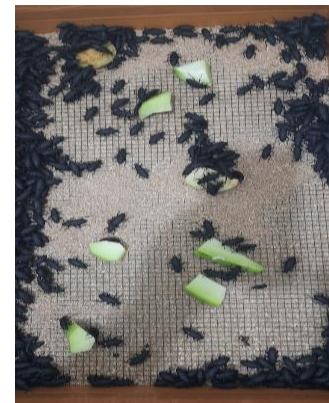
Gambar 3. Kumbang Indukan

Setelah ulat jerman berubah menjadi kumbang dewasa, kumbang dapat dipindahkan dari wadahnya ke kandang yang sudah disiapkan. Kumbang dewasa akan berkembang biak dan bertelur di substrat. Kumbang ulat jerman betina dapat menghasilkan 500 telur.