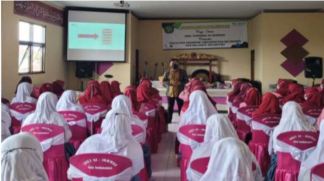
Gambar 2. Pemaparan Materi Pengenalan Pasar Modal

Evaluasi kegiatan dilakukan dengan melakukan posttest setelah pemaparan materi, berdasarkan hasil pre-test dan posttest diketahui terjadi kenaikan indeks literasi keuangan mengenai pasar modal.