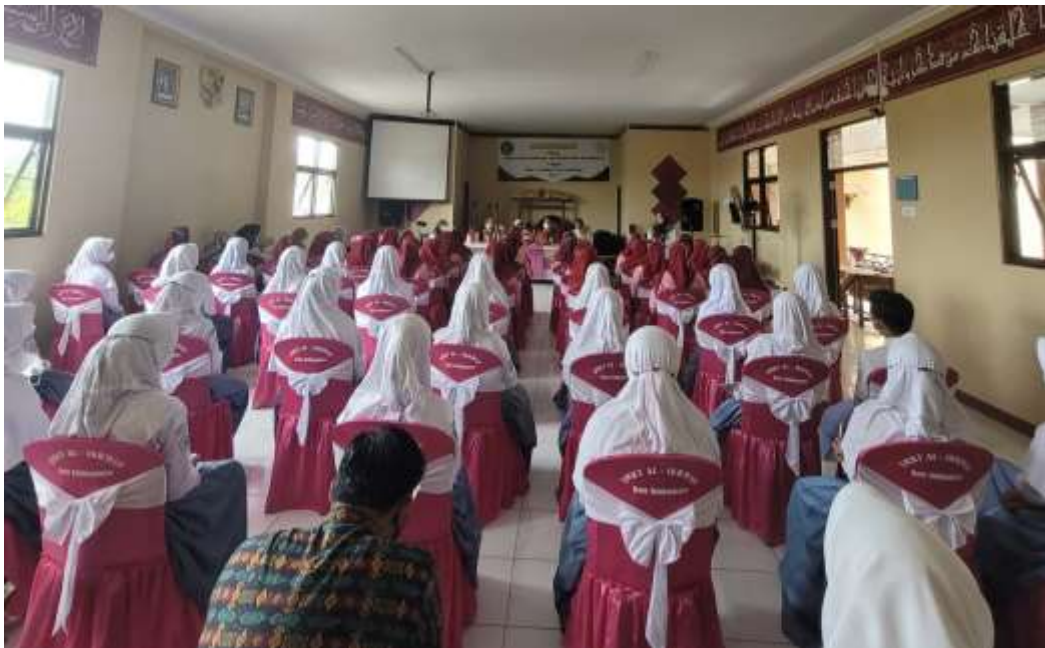
Gambar 1. Pembukaan Acara Pengenalan Pasar Modal Sejak Dini bagi siswa SMK terpadu Al-Ikhwan Kota Tasikmalaya

Kegiatan pengenalan pasar modal sejak dini diawali dengan penyebaran kuesioner kepada seluruh peserta yang bertujuan untuk mengetahui tingkat literasi keuangan sebelum diberikan materi yang terdiri dari 97 siswa dan 5 orang guru. Kegiatan pengenalan pasar modal sejak dini bagi siswa SMK terpadu Al-Ikhwan Kota Tasikmalaya dibuka secara resmi oleh Dekan Fakultas Ekonomi dan Bisnis Universitas Siliwangi.