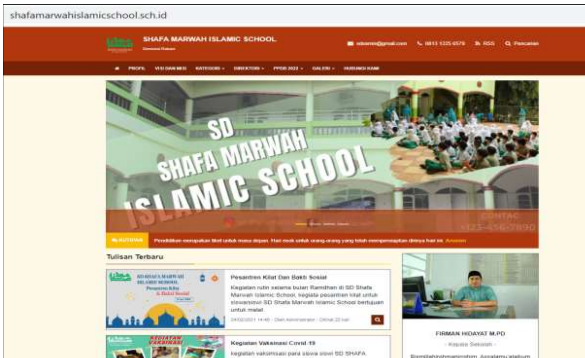
Gambar 4. Tampilan halaman website sekolah