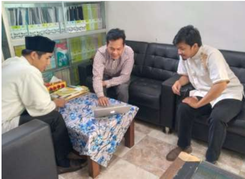
Gambar 2. Dokumentasi kegiatan PkM

Kegiatan pengabdian ini telah terlaksana secara lancar dan sesuai harapan. Kegiatan ini dilaksanakan melalui sosialisasi secara langsung ke lokasi pada tanggal 17 September 2022. Berikut dokumentasi pertemuan dengan mitra pengabdian masyarakat dalam tahap pelaksanaan, persiapan, dan evaluasi.