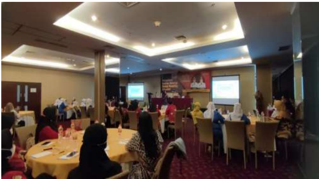
Gambar 3. Pelaksanaan Sosialisasi di THE 101 Hotel Malang

sejumlah 33 orang di lingkungan pemerintah kabupaten malang. Hasil yang diperoleh dari program ini adalah adanya peningkatan pemahaman dan kesadaran peserta tentang pemahaman hak anak dan kewajiban orang tua dalam pola pengasuhan anak, adanya peningkatan peran dan fungsi keluarga dalam pola pengasuhak anak, dan adanya peningkatan kapasitas keluarga dalam mewujudkan keluarga yang berkualitas. Program peningkatan kualitas keluarga melalui Parenting Education ini dilaksanakan pada hari senin tanggal 10 Oktober 2022 di THE 101 Hotel Malang dengan 3 narasumber.