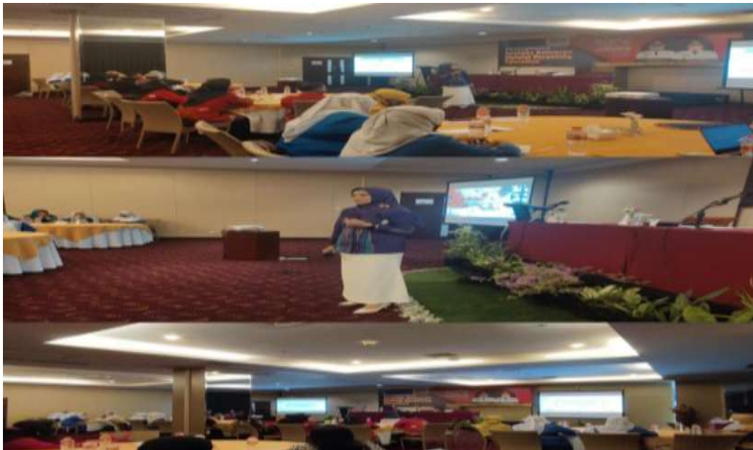
Gambar 2. Pelaksanaan Sosialisasi di THE 101 Hotel

bidang Pemberdayaan Perempuan dan Mutu Keluarga DP3A Kabupaten Malang. Hasil dari diskusi tersebut menghasilkan hasil bahwa masih kurangnya kesetaraan gender dan pemenuhan hak anak. Hasil yang diperoleh dari sosialisasi yang diadakan oleh kolaborasi mahasiswa KPL (Kuliah Praktik Lapangan) dengan Bidang Pemberdayaan Perempuan dan Kualitas Keluarga DP3A kabupaten Malang adalah meningkatnya pemahaman dan kesadaran, peran dan keluarga dalam pola pengasuhan anak dalam keluarga, maka diharapkan dapat mewujudkan kesetaraan gender dalam pola pengasuhan anak sehingga meminimalisir dan mencegah stunting pada anak. Sehingga dapat menciptakan generasi muda yang berkualitas serta mewujudkan kehidupan sosial masyarakat yang stabil, aman, dan nyaman di wilayah Kabupaten Malang.