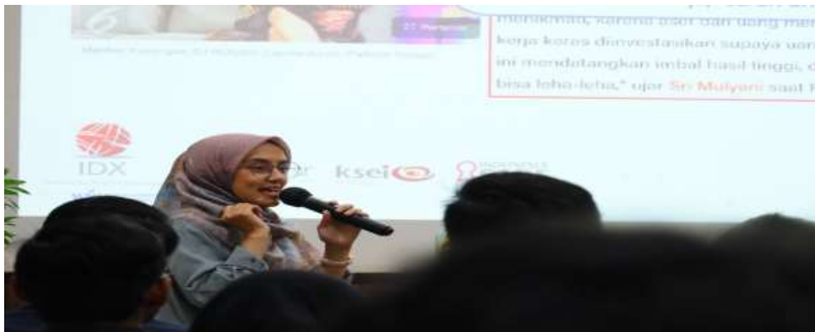
Gambar 5. Materi dari BEI KP Jawa Barat

Mengulas materi terkait overview pasar modal meliputi para pihak yang ada dalam struktur pasar modal beserta fungsi masing-masing, informasi dan teknis pembelian saham, manfaat dan risiko berinvestasi di pasar modal, serta cara cerdas berinvestasi di pasar modal melalui teknik 3P (Paham, Punya, Pantau).