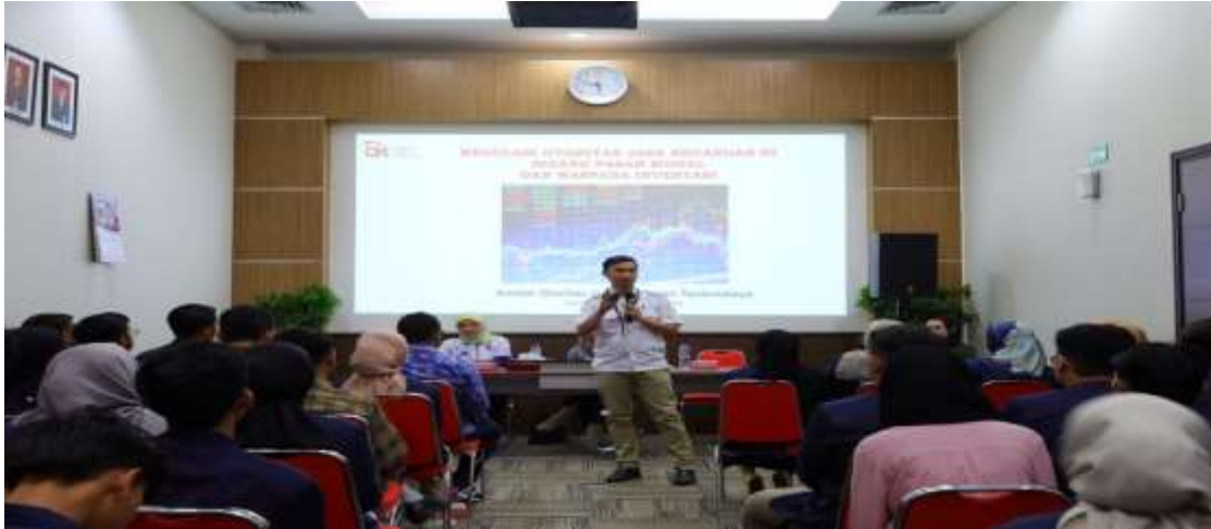
Gambar 4. Materi dari OJK Tasikmalaya

pentingnya meningkatkan akses keuangan kepada masyarakat (inklusi keuangan), berinvestasi dengan cermat serta cara menghindari penipuan melalui investasi ilegal dengan prinsip 2L (Legal dan Logis).