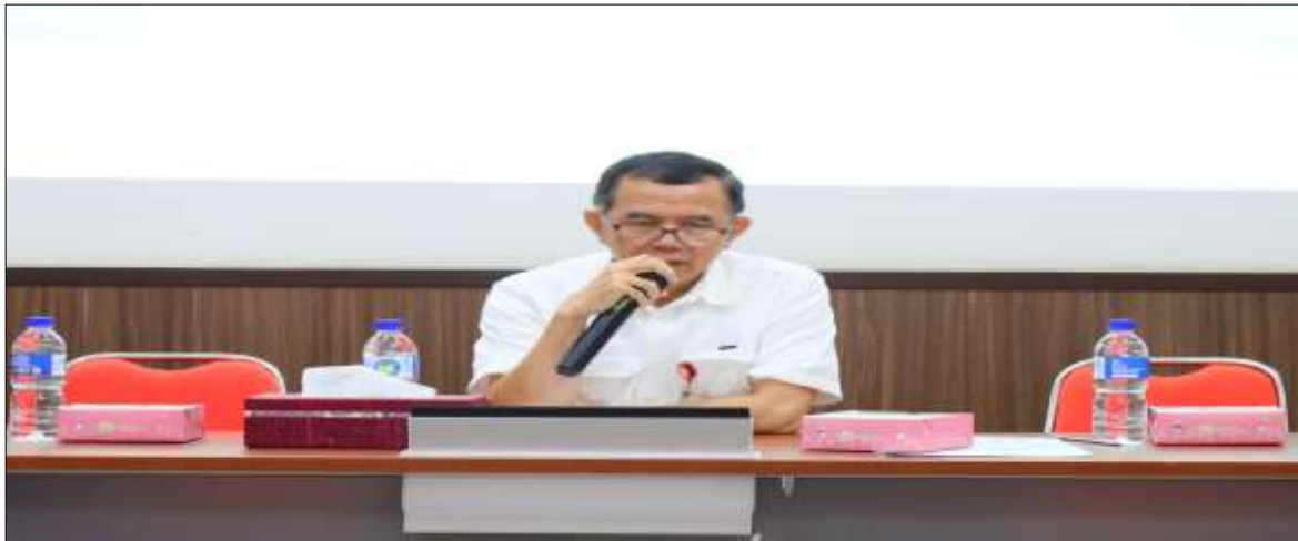
Gambar 3. Sambutan Ketua OJK Tasikmalaya

Acara dibuka dengan sambutan dari Kepala OJK Tasikmalaya