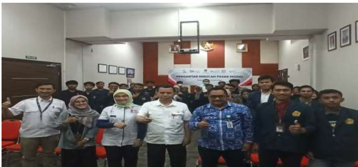
Gambar 7. Peserta Seminar

Selain melalui seminar, kampanye World Investor Week dan Bulan Inklusi Keuangan ini juga disampaikan melalui Instagram Live kolaborasi antara Kantor OJK Tasikmalaya dengan Kantor BEI Jawa Barat yang diselenggarakan pada hari yang sama dengan tema “Investasi Aman Bikin Kamu Nyaman” yang mengupas tuntas kiat-kiat berinvestasi di pasar modal secara aman (Sukmana, 2022). Meskipun dilaksanakan melalui media daring, kegiatan tersebut mampu menarik antusiasme masyarakat dengan berbagai interaksi dan pertanyaan-pertanyaan yang disampaikan oleh masyarakat melalui kolom komentar instagram.