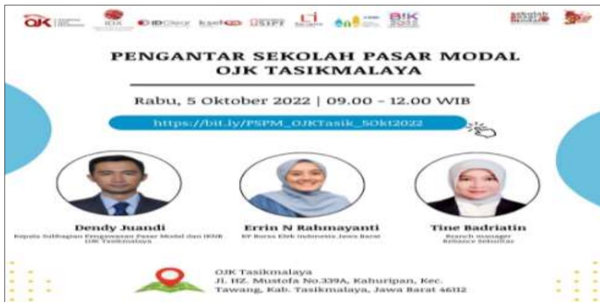
Gambar 2. E-Flyer Kegiatan

Adapun penyebaran informasi kegiatan kepada peserta disebarakan melalui e-flyer yang disebarakan di media sosial kampus yang menjadi mitra kegiatan pengabdian ini. Para peserta diminta mengisi pendaftaran kegiatan sebagaimana tertera dalam e-flyer yang disebar berikut ini :