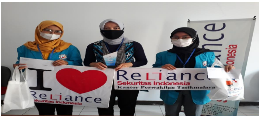
Gambar 6. Penyerahan Plakat dan Merchandise kepada Pimpinan Perusahaan oleh Pemegang Politeknik Triguna