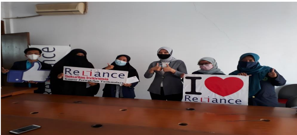
Gambar 5. Pelepasan / perpisahan peserta magang oleh Pimpinan Perusahaan dengan perwakilan pemegang dari STAI Tasikmalaya