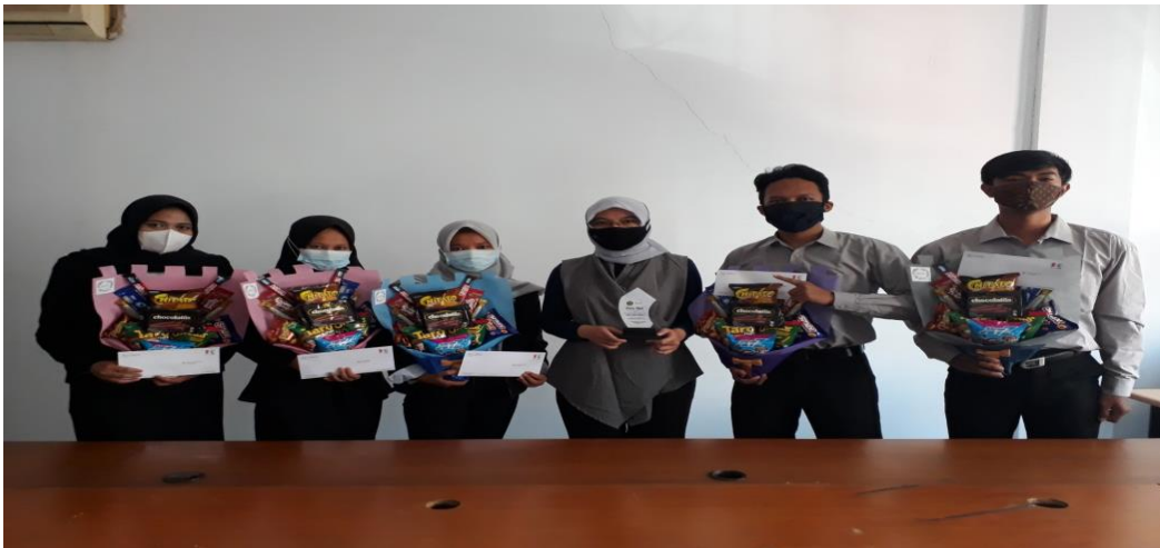
Gambar 4. Penyerahan Plakat dari Pemegang UNSIL kepada Pimpinan Perusahaan