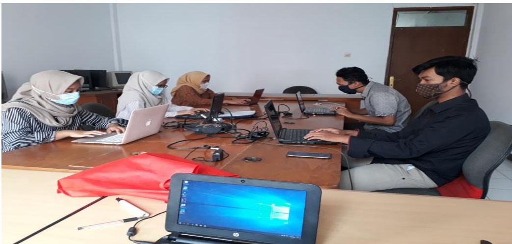
Gambar 3. Pemegang dari STAI dalam kegiatan magang offline

Materi online yang disampaikan dilakukan oleh pemateri dari Perusahaan selain dengan pendampingan dari Dosen Pembimbing pemegang. Untuk kegiatan offline dari pemegang yaitu membantu staf administrasi dalam pelaksanaan input data dan pengisian serta pengajaran tata cara opening account untuk para