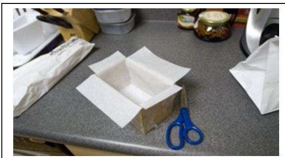
Gambar. 11 Buat Tempat Sabun /Cetak