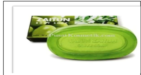
Gambar. 6 Sabun Minyak Zaitun dan Kemasannya