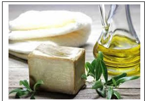
Gambar 7 Sabun dari Minyak Zaitun