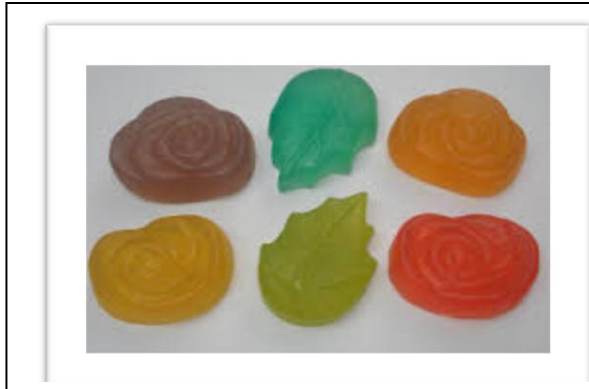
Gambar. 3 Aneka Warna Sabun Bentuk Bunga

ibu-ibu rumah tangga yang terinfeksi HIV/AIDS di desa tersebut berwirausaha mandiri setelah mendapat pelatihan: