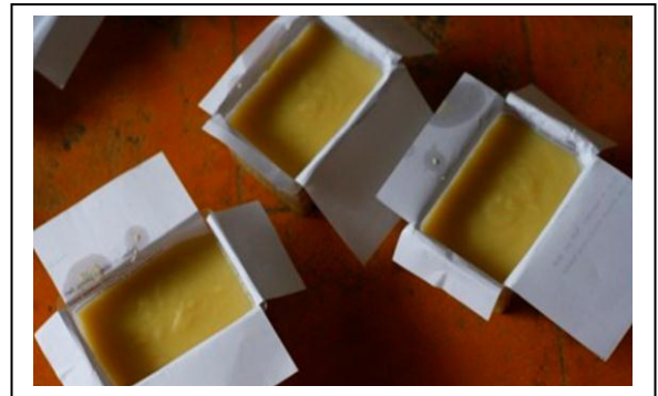
Gambar 13 Sabun di Cetak