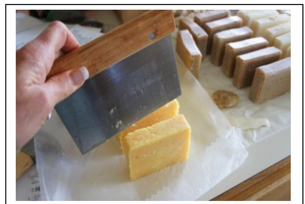
Gambar. 14 Sabun Zaitun di potong-potong