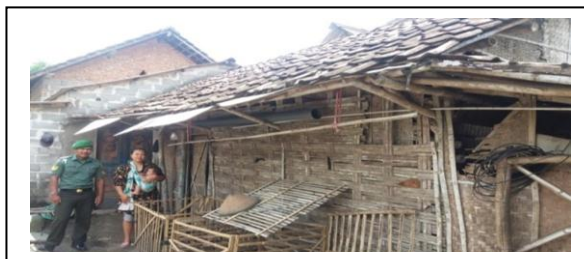
Gambar 2 : Rumah Masyarakat Pra Sejahtera Desa Jabon

Maka dengan gambar diatas, menunjukkan bahwa kemampuan masyarakat yang dapat dikembangkan tentunya banyak sekali seperti kemampuan untuk berusaha, kemampuan untuk mencari informasi, kemampuan untuk dalam mengelola kegiatan di desa, kemampuan dalam pertanian dan masih banyak lagi sesuai dengan kebutuhan atau permasalahan yang dihadapi oleh masyarakat. Apa yang perlu dikembangkan dari masyarakat sendiri, yaitu suatu potensi atau kemampuannya, dan sikap dalam hidupnya. Kemampuan masyarakat yang meliputi antara lain kemampuan