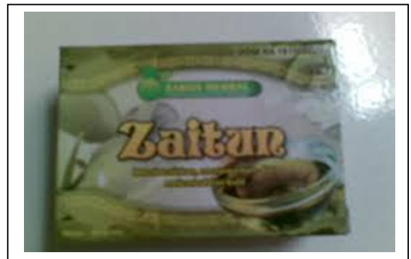
Gambar. 15 Contoh Kemasan Sabun