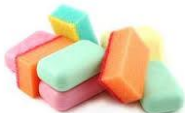
Gambar. 5 Aneka Warna Sabun bentuk segi empat