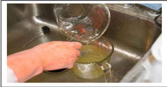
Gambar. 9 Menuangkan Minyak Zaitun