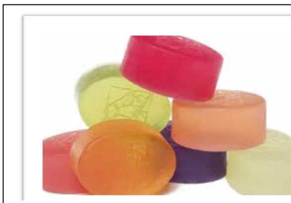
Gambar. 4 Aneka Warna Sabun bentuk Bulat