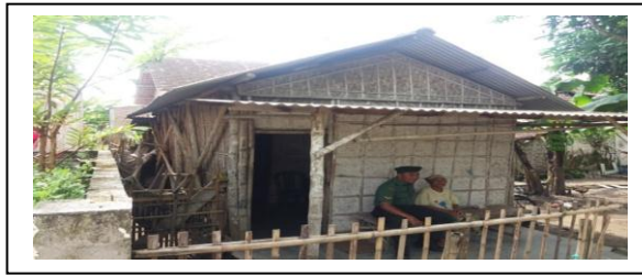
Gambar 1 : Rumah Masyarakat Pra Sejahtera Desa Jabon