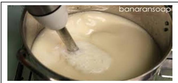
Gambar . 10 Blender Sabun Minyak Sabun Zaitun