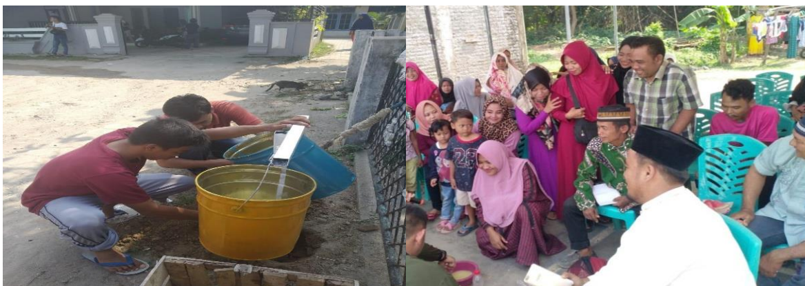
Gambar 2 Tahap Pelaksanaan Penyuluhan dan Pemasangan Tong Sampah

Warga yang datang tampak antusias dengan mengajukan banyak pertanyaan sehingga sesi diskusi menjadi menarik, materi juga dibagikan dalam bentuk cetak. Materi dilanjutkan esok harinya dengan pemberian drum sampah kepada ketua RW 11 Kelurahan Kaligandu, dan dilanjutkan dengan pemasangan drum yang ditanam didalam tanah sehingga tidak terjadi lagi kehilangan drum sampah, masing masing RT menerima dua pasang drum untuk sampah organik dan anorganik kepada RT01, RT02 dan RT 03. Selain itu juga drum sampah diberikan kepada sekolah sekolah, madarasah dan masjid melalui Ketua RW11.