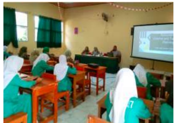
Gambar 1. Kegiatan Pelatihan dan Pengenalan Aplikasi Accurate Accounting