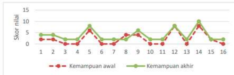
Gambar 3. Hasil test kemampuan accurate accounting peserta pelatihan yang diuji pada awal dan akhir kegiatan pengabdian.

bagi siswa dan guru. Untuk mengevaluasi efektivitas pelatihan, penilaian kemampuan peserta dilakukan pada awal dan akhir kegiatan. Penilaian ini menggunakan kuesioner yang diberikan ke peserta di awal dan akhir pelatihan.