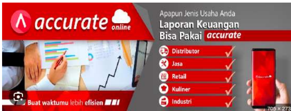
Gambar 2. Aplikasi Accurate Accounting

Kegiatan pengabdian masyarakat yang dilaksanakan di SMK N 1 Bukit Kemuning berhasil memberikan dampak positif baik dalam jangka pendek maupun jangka panjang