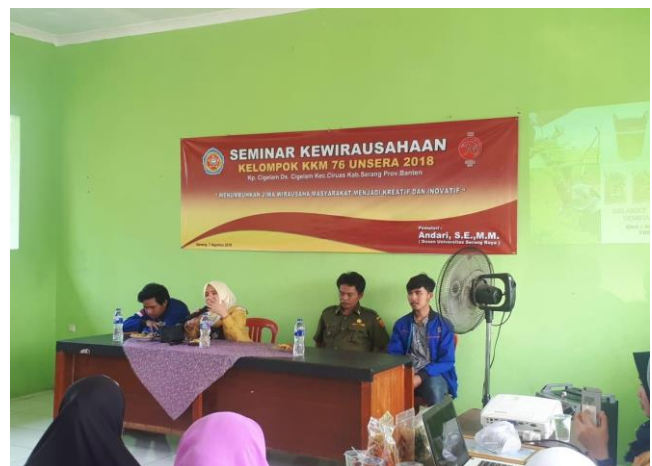
Gambar 3. Kegiatan Seminar Kewirausahaan