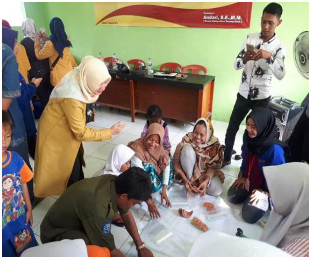
Gambar 5. Kegiatan pembuatan rempeyek bayam

nilai jual lebih tinggi. Pada kegiatan pelatihan ini di demostrasikan cara membuat rempeyek bayam.