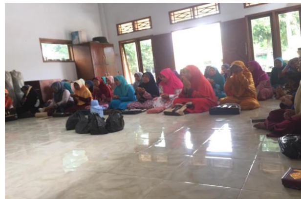
Gambar 2. Kegiatan wawancara dengan warga Desa Cigelam