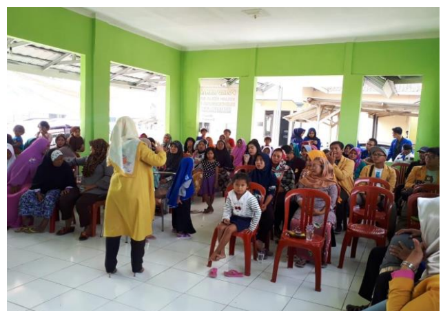
Gambar 4. Kegiatan Seminar Wirausaha