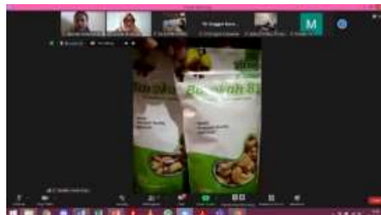
Gambar 4. Diskusi Peserta dan Pemateri

Pada sesi tanya jawab, peserta tidak hanya bertanya mengenai materi yang disampaikan tetapi juga dapat berkonsultasi dengan pemateri mengenai usahanya. Salah satu peserta kegiatan berkonsultasi mengenai kemasan dari produknya. Pemateri memberikan saran dan masukan agar kemasan produk tersebut menjadi lebih menarik bagi pelanggan dan dapat menjaga kualitas produk yang terdapat di dalam kemasan tersebut.