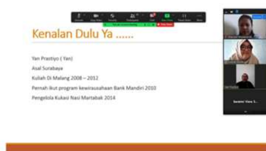
Gambar 3. Pemaparan Materi Oleh Bapak Yan Prastiyo

Materi kedua disampaikan oleh Bapak Yan Prastiyo yang merupakan pendiri dan pengelola Kukasi Nasi Martabak. Beliau menyampaikan materi mengenai Strategi Pengembangan Bisnis Agar Tetap Bertahan di Era Disruptif Bagi UMKM. Perubahan perilaku konsumen di Era Disrupsi ini berdampak pada UMKM. Strategi yang dapat dilakukan diantaranya adalah melakukan inovasi produk, strategi dalam penetapan harga, menyediakan tempat yang menarik baik dalam bentuk toko fisik maupun toko online, serta memanfaatkan sosial media untuk promosi dan memperluas pasar. Era Disrupsi merupakan peluang UMKM untuk bertumbuh dengan inovasi produk agar dapat bertahan dan berkembang, serta memanfaatkan penggunaan teknologi dapat dilakukan UMKM untuk mengembangkan pasar dan melakukan promosi. Hal ini sejalan dengan (Hani & Rokhmani, 2018), bahwa pelaku usaha tidak hanya melakukan kreasi dalam berwirausaha tetapi juga dapat menciptakan sesuatu yang baru dan berbeda. Materi yang disampaikan Bapak Yan Prastiyo memotivasi peserta untuk memanfaatkan peluang yang tercipta di Era Disrupsi ini dan mendorong para peserta calon pelaku usaha agar tidak takut untuk memulai bisnis.