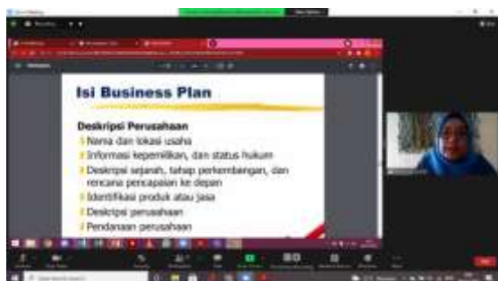
Gambar 2. Pemaparan Materi Oleh Ibu Peni Budi Astuti

Materi kedua disampaikan oleh Bapak Yan Prastiyo yang merupakan pendiri dan pengelola Kukasi Nasi Martabak. Beliau menyampaikan materi mengenai Strategi Pengembangan Bisnis Agar Tetap Bertahan di Era Disruptif Bagi UMKM. Perubahan perilaku konsumen di Era Disrupsi ini berdampak pada UMKM. Strategi yang dapat dilakukan diantaranya adalah melakukan inovasi produk, strategi dalam penetapan harga, menyediakan tempat yang menarik baik dalam bentuk toko fisik maupun toko online, serta memanfaatkan sosial media untuk promosi dan memperluas pasar. Era Disrupsi merupakan peluang UMKM untuk bertumbuh dengan inovasi produk agar dapat bertahan dan berkembang, serta memanfaatkan penggunaan teknologi dapat dilakukan UMKM untuk mengembangkan pasar dan melakukan promosi. Hal ini sejalan dengan (Hani & Rokhmani, 2018), bahwa pelaku usaha tidak hanya melakukan kreasi dalam berwirausaha tetapi juga dapat menciptakan sesuatu yang baru dan berbeda. Materi yang disampaikan Bapak Yan Prastiyo memotivasi peserta untuk memanfaatkan peluang yang tercipta di Era Disrupsi ini dan mendorong para peserta calon pelaku usaha agar tidak takut untuk memulai bisnis.