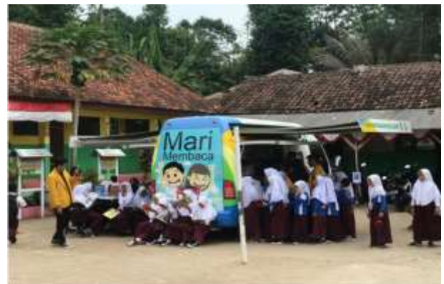
Gambar 2. Kegiatan membaca anak-anak

Kegiatan literasi secara umum telah berjalan dengan baik dan lancar. Tingkat penyerapan peserta terhadap pemaparan dan praktik yang diberikan oleh nara sumber cukup baik dilihat dari antusiasme peserta dalam bertanya terkait materi yang diberikan oleh nara sumber. Permasalahan yang dikemukakan oleh nara sumber ditanggapi dengan menanyakan kembali hal-hal yang terkait dengan kegiatan literasi yang biasa dilakukan oleh peserta. Melalui sesi Tanya jawab dapat dilakukan pengukuran pada kegiatan ini. Pengukuran tersebut untuk melihat apa yang mereka pelajari dalam kegiatan literasi benar-benar bermanfaat untuk meningkatkan kemampuan membaca dan membudayakan membaca bagi generasi bangsa. Evaluasi dilakukan untuk melihat apakah tujuan kegiatan literasi tersebut sudah tercapai? Adapun tujuan kegiatan literasi ini adalah berbagi informasi tentang sebuah pendekatan yang dapat digunakan untuk meningkatkan kemampuan membaca. Untuk itu, setelah mengikuti kegiatan peserta diharapkan dapat mempraktikkan pendekatan extensive reading di lingkungan sekolah terhadap anak didiknya dan di rumah bagi orang tuanya terhadap anak-anaknya.