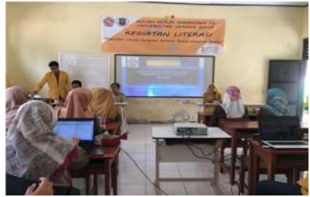
Gambar 1. Pemaparan materi

membaca dengan memilih buku yang sudah disediakan oleh panitia melalui kerjasama dengan perpustakaan keliling. Setelah kegiatan membaca selesai, siswa siswi dikelompokkan menjadi beberapa kelompok yang dipimpin oleh satu mentor dari panitia. Mentor tersebut mengevaluasi hasil bacaan anak-anak, kemudian saling memaparkan hasil bacaannya sehingga antara satu dengan yang lainnya menerima banyak informasi yang didapat.