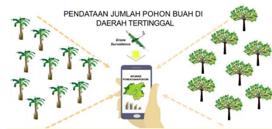
Gambar 3. Pendataan Jumlah Pohon Buah

pohon dan sayu dapat menggunakan teknologi Artificial Intelegence Drone Surveillance .