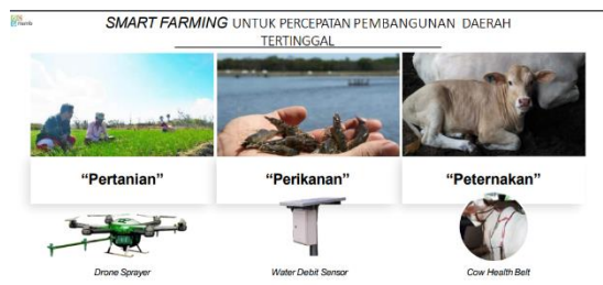
Gambar 2. Penerapan Smart Farming

Selanjutnya adalah skema pendataan jumlah pohon buah di daerah tertinggal. Daerah tertinggal memiliki perkebunan buah namun banyak pohon buah yang ditanam di kebun-kebun rumah penduduk. Hal tersebut dapat meningkatkan skala ekonomi apabila dikonsolidasi melalui pendataan jumlah pohon buah dalam suatu kawasan serta waktu panen (untuk kebutuhan logistik dan tenaga kerja). Pendataan