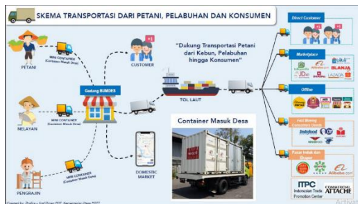
Gambar 1. Skema Transportasi Petani, Pelabuhan dan Konsumen

Selain skema lain yang direncanakan oleh Kementerian PDT dalam rangka meningkatkan predikat daerah tertinggal adalah penerapan smart farming yang dilakukan di setiap desa diberbagai daerah. Smart farming adalah penggabungan teknologi dalam peningkatan produksi hasil pertanian, perikanan dan peternakan di seluruh daerah tertinggal.