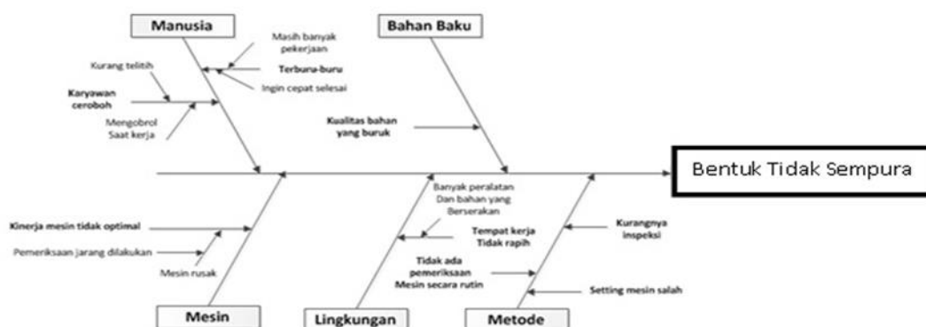
Gambar 5. Diagram Sebab Akibat Untuk Bentuk Genteng Tidak Sempurna