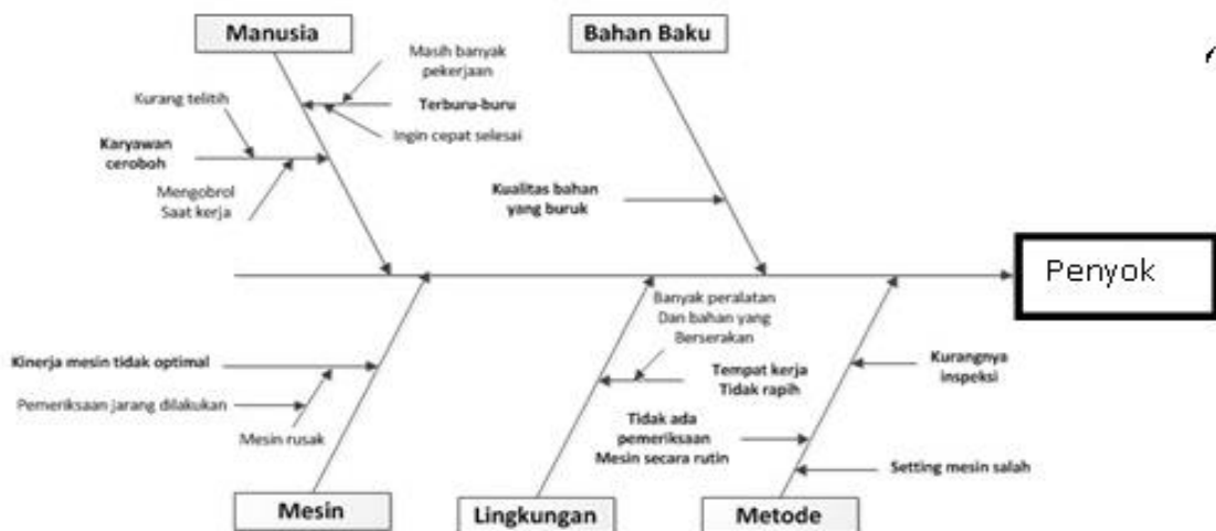
Gambar 3. Diagram Sebab Akibat untuk Cacat Genteng Penyok