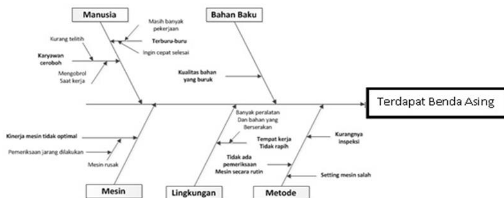
Gambar 4. Diagram Sebab Akibat Akibat Terdapat Benda Asing