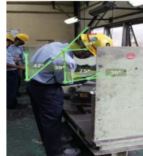
Gambar 2. Hasil Penarikan Sudut Menggunakan Software Kinovea

Penilaian postur kerja dilakukan untuk mengetahui tingkat risiko yang ditimbulkan oleh suatu aktivitas sehingga dapat diambil tindakan sesuai dengan tingkat risiko yang terjadi. Penarikan garis untuk mengukur sudut postur kerja operator polishing dies dilakukan menggunakan software Kinovea ( Gambar 2 ). Tabel 11 merupakan deskripsi hasil penarikan sudut postur kerja operator polishing dies . Berat beban ( Load ) alat proses polishing dies ( mini die grinder ) adalah 3.7kg, sedangkan faktor coupling proses polishing dies adalah good .