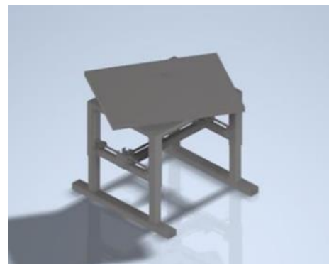
Gambar 3. Desain 3D Adjuster Table