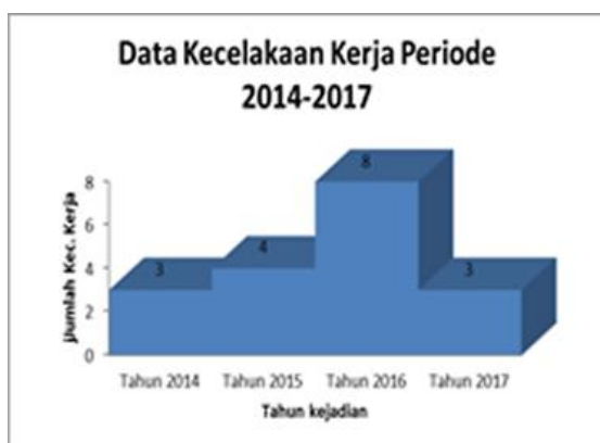
Gambar 1. Data Kecelakaan Kerja Periode 2014-2017

Perusahaan pengelolaan apartemen ini beralamat di Jalan Marsekal Suryadarma No. 1 Tangerang adalah pengelola gedung Apartemen Tamansari Skylounge, Operasional gedung Apartemen Tamansari Skylounge diawali pada akhir tahun 2014. Dalam menjalankan pengelolaan gedung apartemen Tamansari Skylounge Tangerang masih terjadi kecelakaan dalam proses pekerjaan. Berikut ini adalah data kejadian kecelakaan kerja dari tahun 2014 sampai 2017 (Gambar 1).