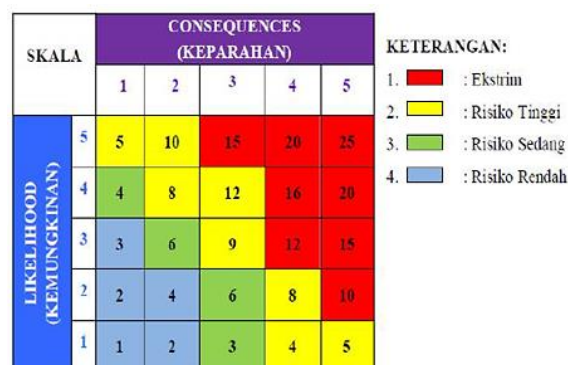
Gambar 2. Risk Matriks